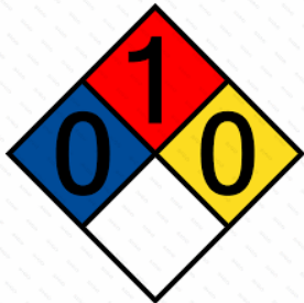
Rombo NFPA 704